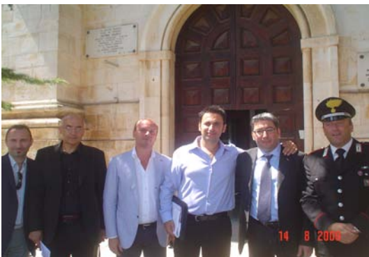
Stefano Caporizzi (UIL) e l'On. Zazzera oggi a TURI

CARCERI: ZAZZERA (IDV), A TURI MANCANO ATTIVITA' RECUPERO (ANSA) - TURI (BARI), 14 AGO - "A Turi la pianta organica degli operatori e' ferma al 2001 e non tiene conto del sovraffollamento della struttura che, progettata per 112 detenuti, oggi ne ospita 175" . Lo afferma il deputato Pierfelice Zazzera (Idv) in una nota nella quale informa di aver visitato oggi il carcere locale (nel ventennio furono ospitati, tra gli altri, Antonio Gramsci e Sandro Pertini ndr). "Mancano, a causa delle carenze strutturali e di organico - aggiunge - le attivita' di recupero. Qui su 175 detenuti, 173 scontano una pena definitiva: per essi e' fondamentale un progetto di rieducazione e di reinserimento". "Piu' volte abbiamo dichiarato la nostra contrarieta' a provvedimenti come l'indulto - conclude Zazzera - ma riteniamo che vi siano altre ipotesi su cui ragionare: in primo luogo, far scontare la pena ai detenuti stranieri nei paesi di origine attraverso accordi bilaterali. In secondo luogo per i reati minori le pene potrebbero essere scontate in maniera diversa rispetto alla detenzione". (ANSA). DES 14-AGO-09 16:55 NNN