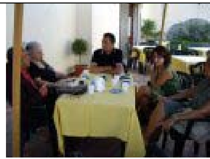
Gioacchino Veneziano e la delegazione UIL con l'On. Rita Borsellino in visita a Trapani 14.08.09