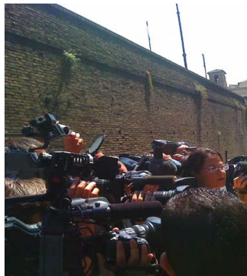
La conferenza stampa a Regina Coeli